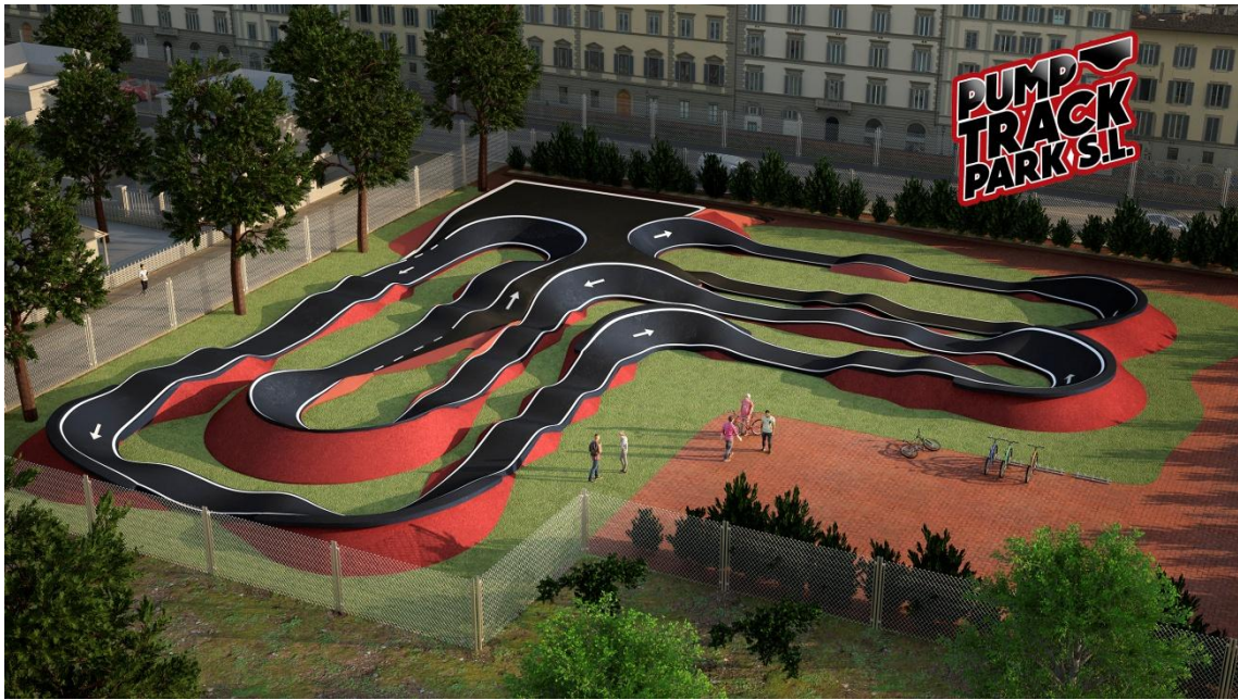
Exemple Pumtrack 1.200m2 acabat premium plus 90.000 eurs + iva