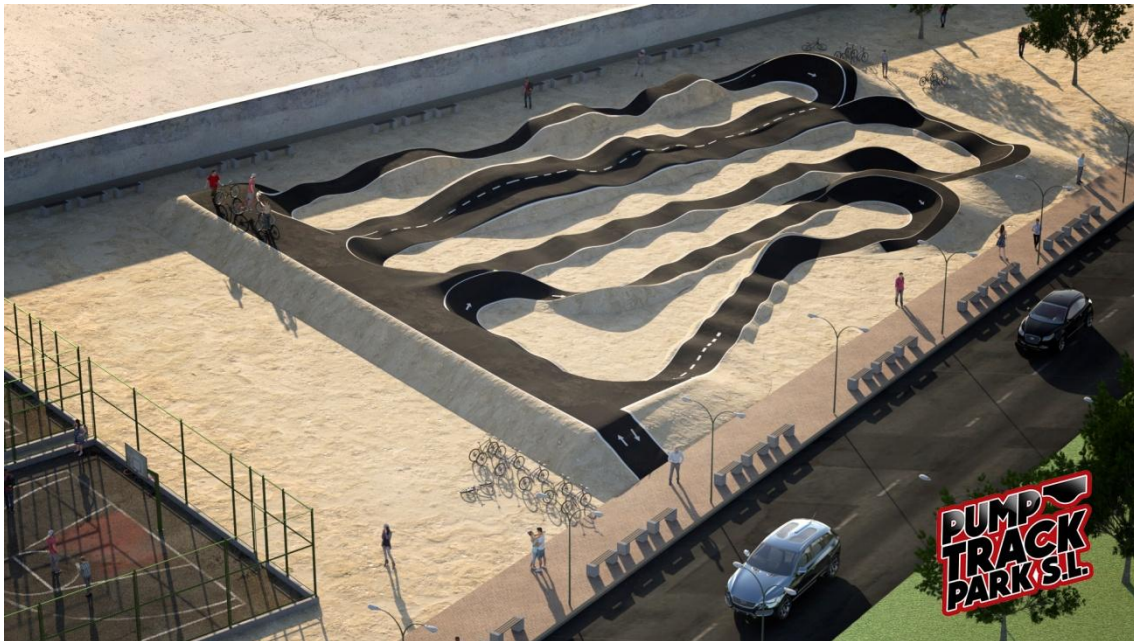
Exemple Pumtrack 2.100m2 acabat Popular Plus 94.500 eurs + iva