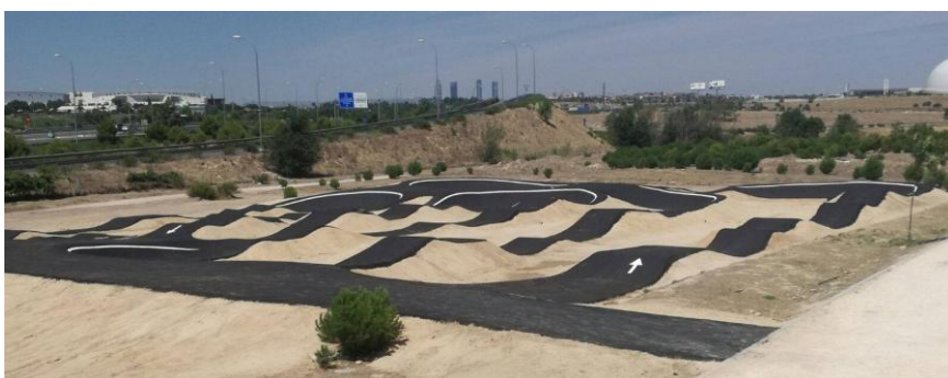
Detall d'acabat Popular Plus en terreny de 2.500 m 2

Amb una superfície gran i poc pressupost aquesta opció te l'avantatge d'aconseguir un Pumptrack molt popular com a primera instal·lació esportiva. Inclou l'estud i disseny del mateix, tot el moviment de terres, perfilat i compactat artesanal de la capa de rodadura en asfalt calent.