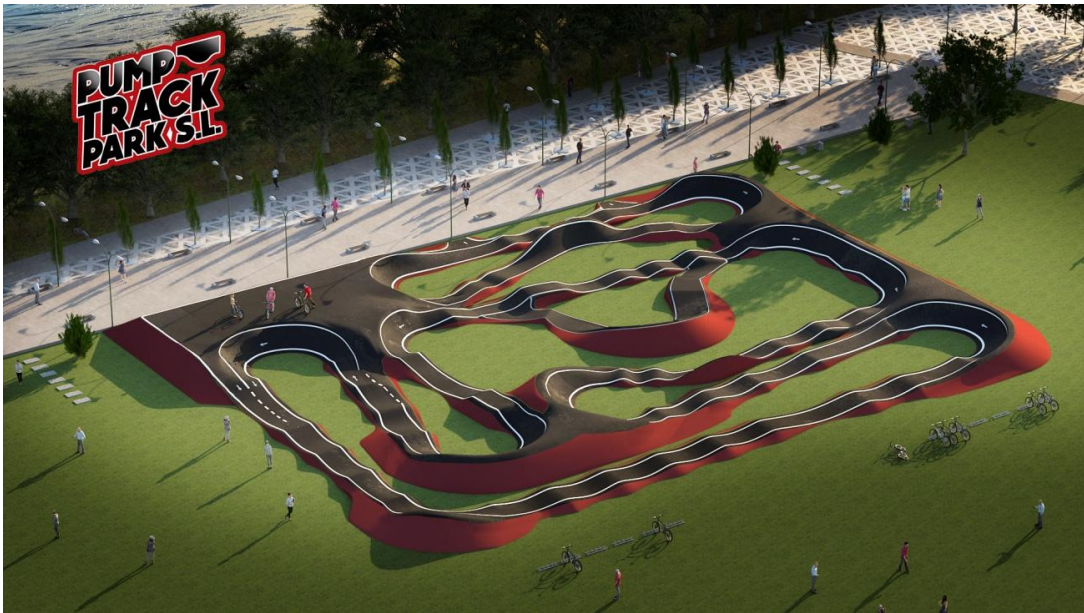
Detall acabat Premium en terreny de 1.000 m 2

Aquesta opció inclo gespa artificial en totes les illes interiors.