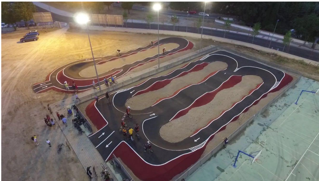
Detall acabat Popular Plus en terrenys de 1.200 m 2

Els talusos van pintats amb Slurry de color a escollir, donant-li major durabilitat de vida a la instal·lació i vistositat.